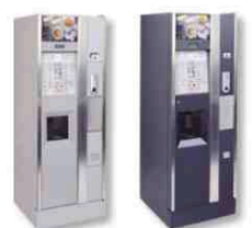
Colores estándar serie Antares.

COMPANIES WITH CERTIFIED QUALITY SYSTEM UN EN ISO 9001:94