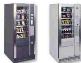
Colori standard serie Vega 700.

AZIENDE CON SISTEMA QUALITÀ CERTIFICATO UN EN ISO 9001:94